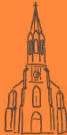
Pirna St. Kunigunde