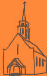
Neustadt—Sebnitz St. Gertrud