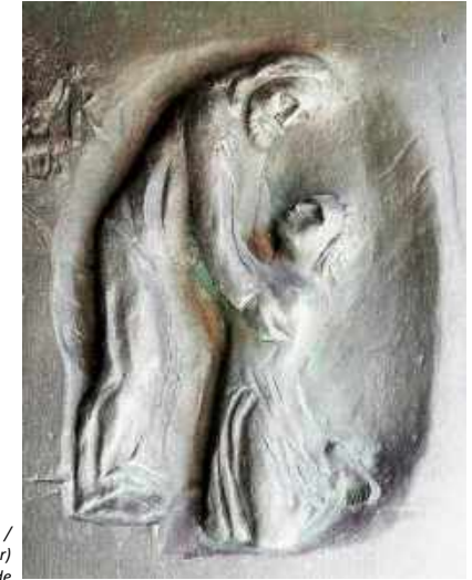
Bild: Friedbert Simon (Fotografie) / Roland Friederichsen (Künstler) In: Pfarrbriefservice.de

Pirna: jeden 1. Donnerstag im Monat um 17.30 Uhr (Pfarrkirche)