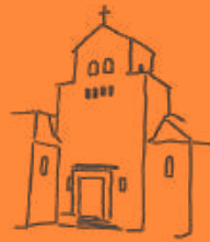
Heidenau St. Georg