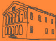
Bad Schandau—Königstein Maria, Mittlerin aller Gnaden