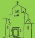
Heidenau St. Georg